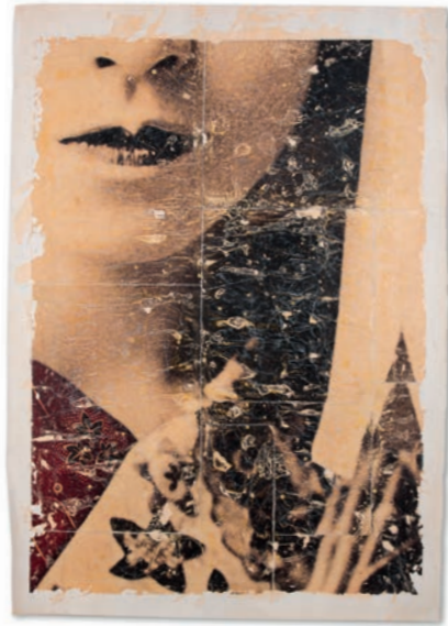
Kairos n. 008 Fotografia antiga amb tècnica mixta i collage Paper Fabriano, 114,5 x 86,5 cm Peça única, 2020