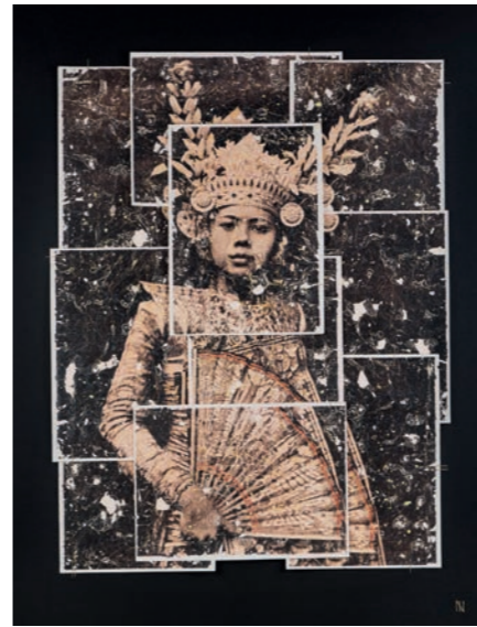
Colonitzada n. 60 Ballarina balinesa amb el tradicional legong, Indonesia, 1929 Autor desconegut Fotografia antiga amb tècnica mixta i collage, 120 x 100 cm Peça única, 2019

Montse Frisach Periodista i crític d'art