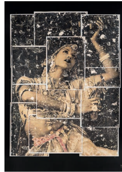
Colonitzada n. 61 Ballarina, India, 1898 Autor desconegut Fotografia antiga amb tècnica mixta i collage Paper d'aquarella sobre tela, 130 x 100 cm Peça única, 2019