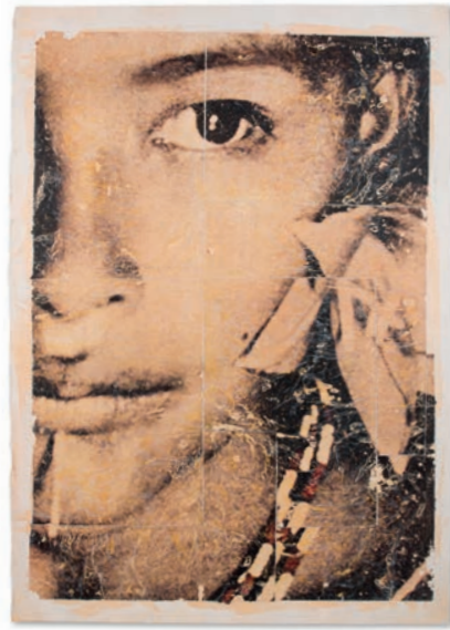
Kairos n. 007 Fotografia antiga amb tècnica mixta i collage Paper Fabriano, 114,5 x 86,5 cm Peça única, 2020