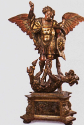
Sant Miquel vençant el dimoni , final del segle XVI - inici del segle XVII Museu Frederic Marès