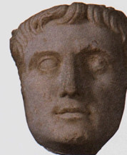
Retrat d'August , segle I dC Museu Frederic Marès