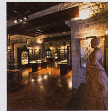
Sala femenina Museu Frederic Marès