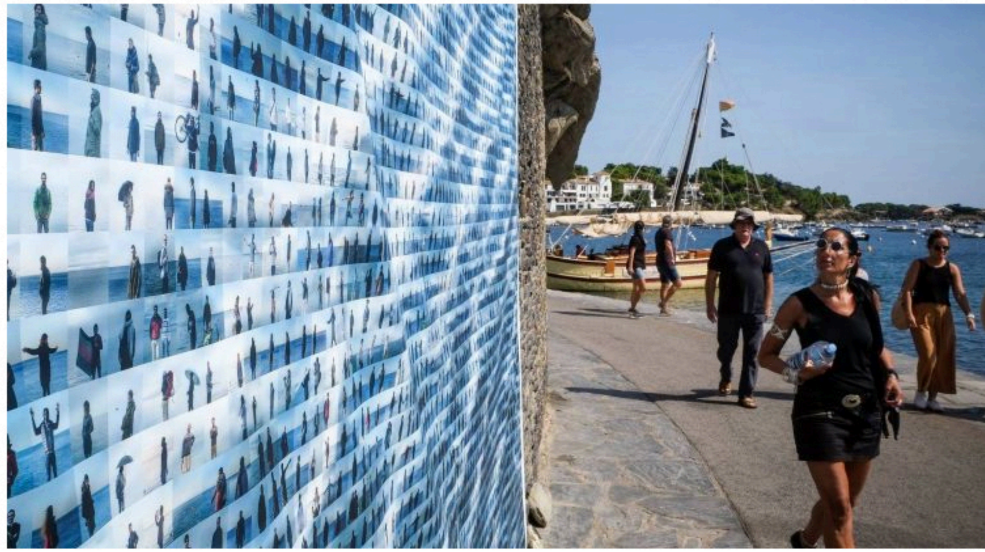
Un dels espais de la mostra de l'any passat