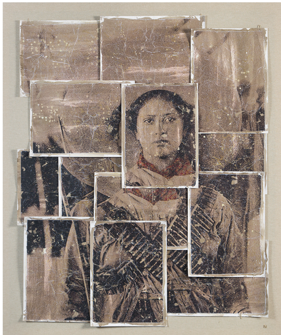
watercolor paper on canvas · 130 x 110 cm · 2018