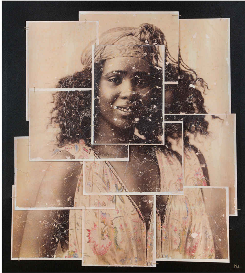
watercolor paper on canvas · 100 x 110 cm · 2018