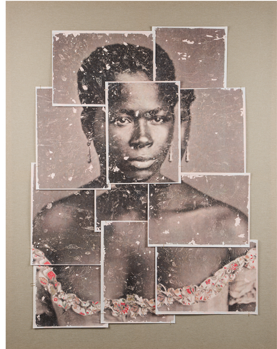
watercolor paper on canvas · 110 x 140 cm · 2017