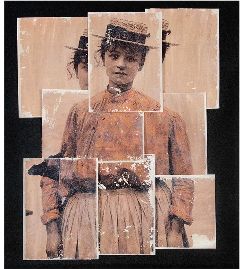
watercolor paper on canvas · 100 x 110 cm · 2018