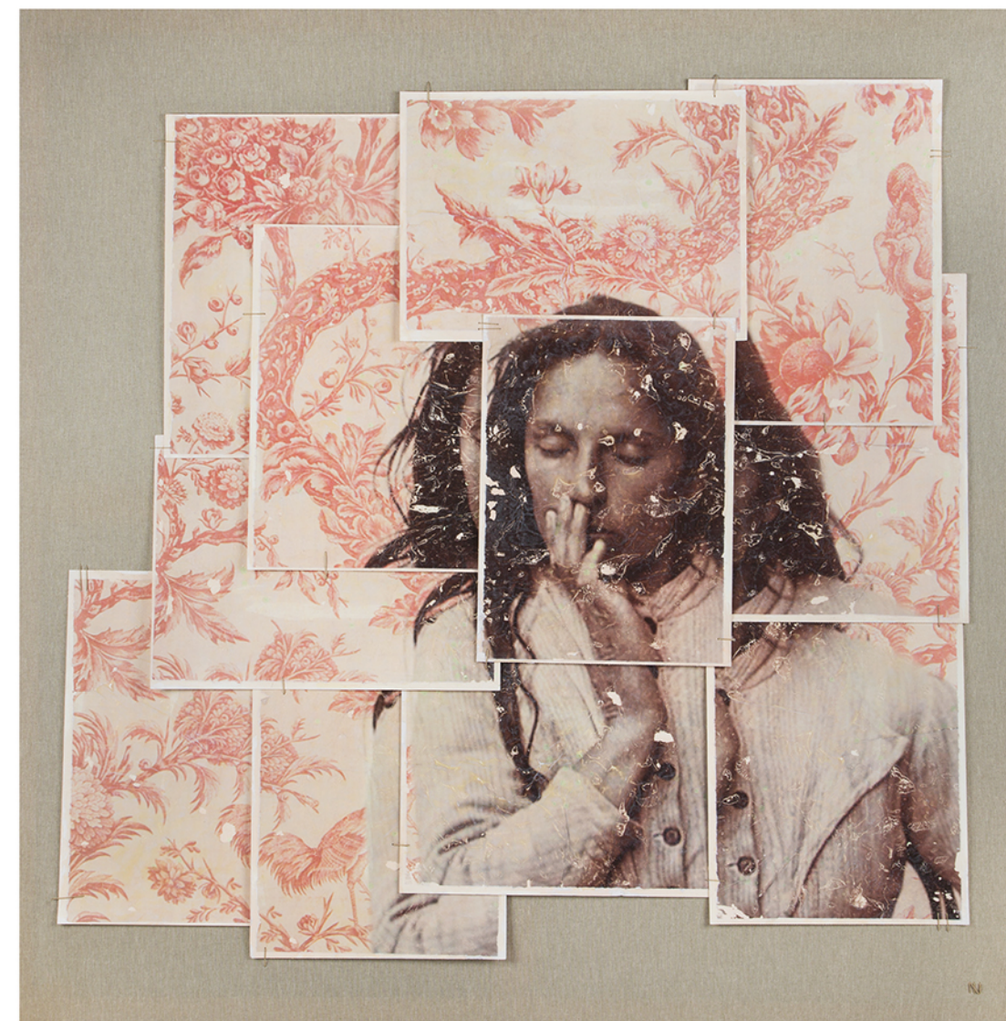
watercolor paper on canvas · 120 x 120 cm · 2018