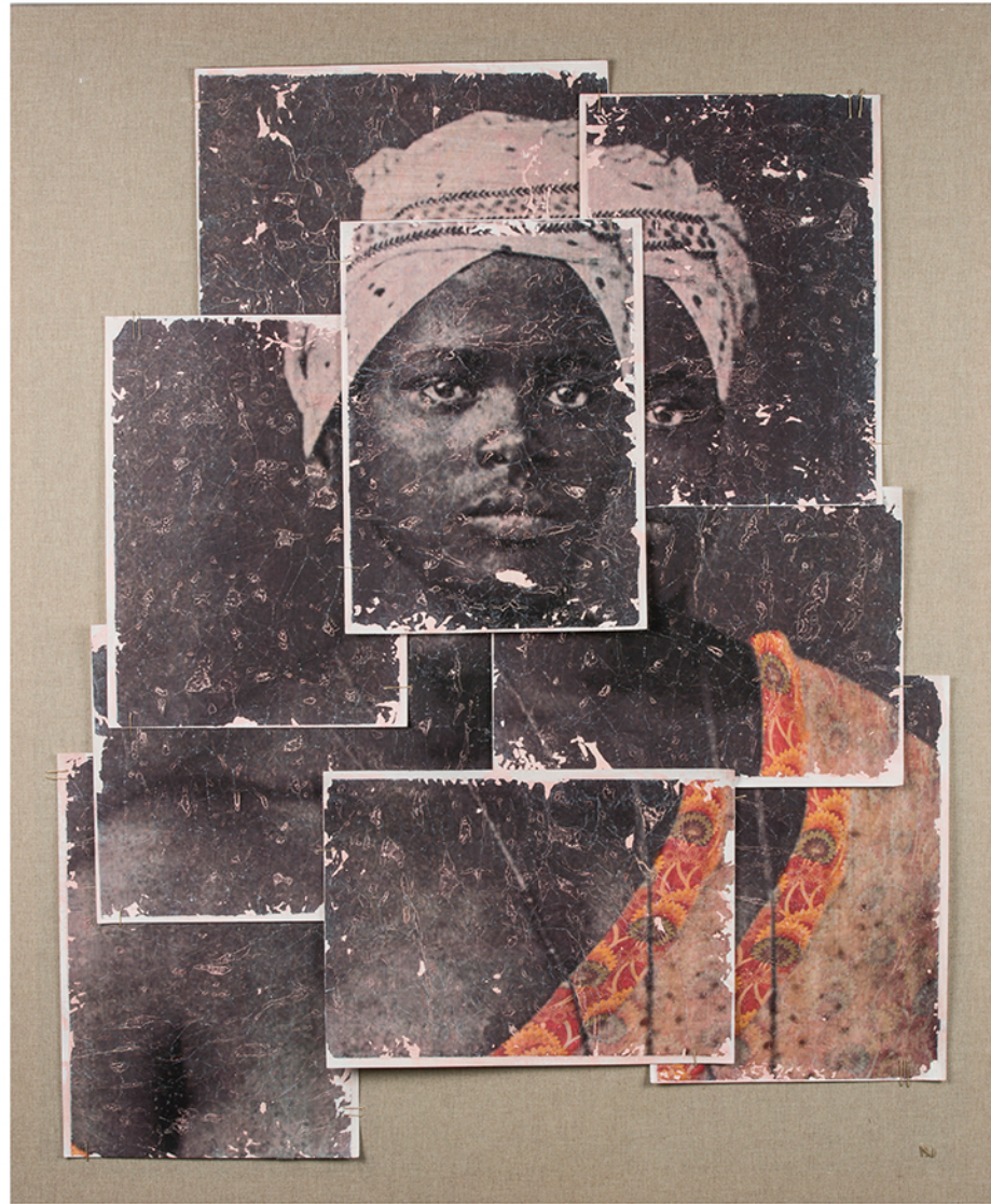
watercolor paper on canvas · 120 x 130 cm · 2018