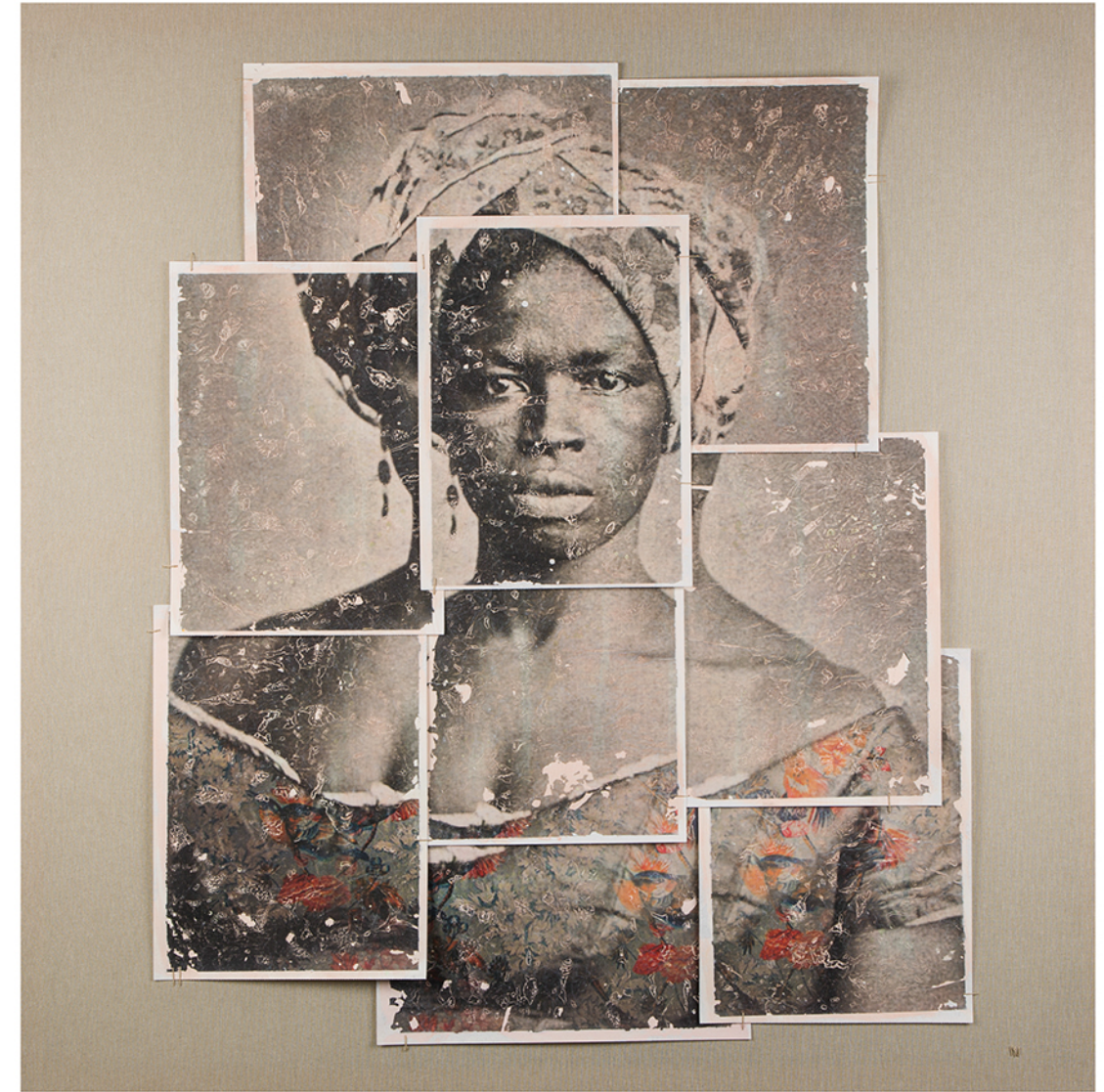
watercolor paper on canvas · 120 x 120 cm · 2017