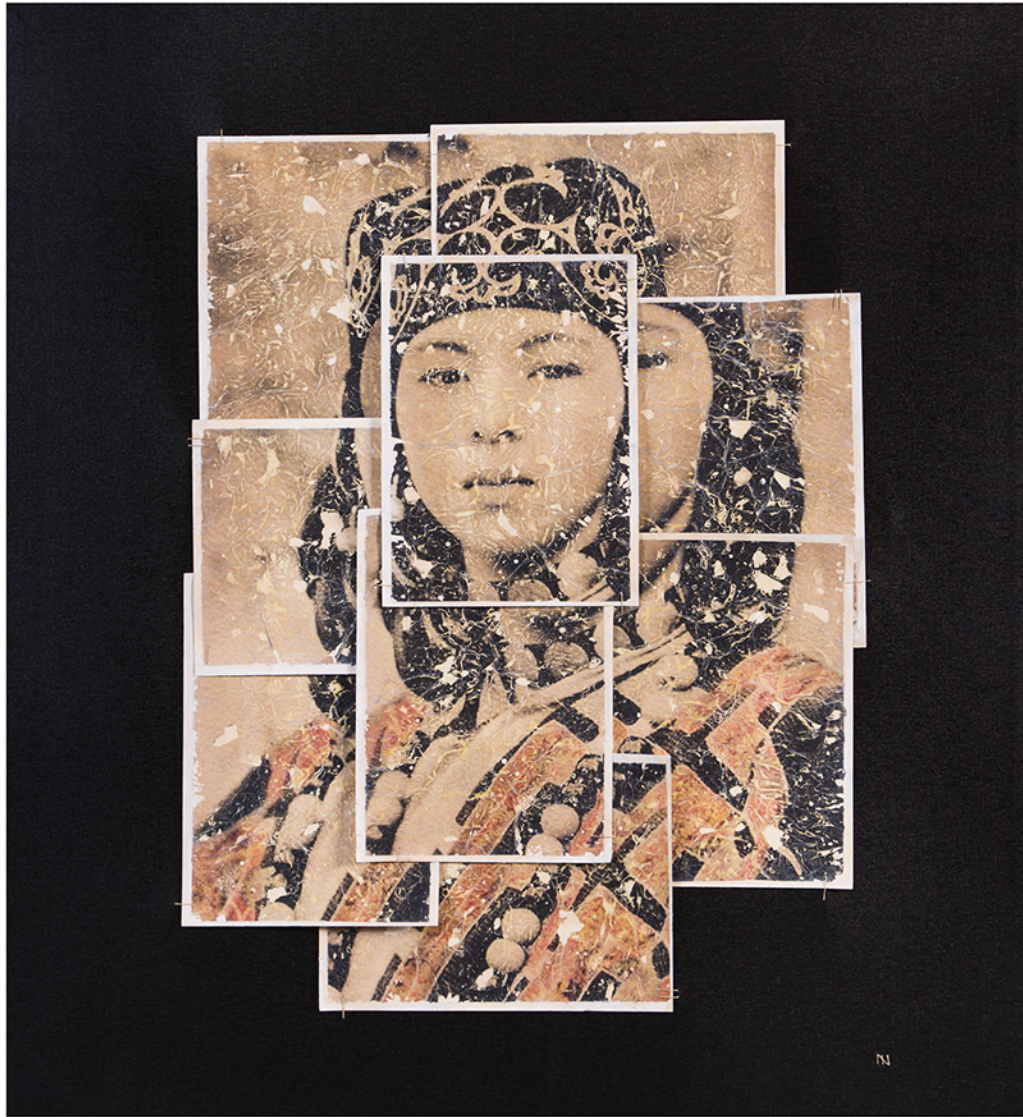
watercolor paper on canvas · 130 x 120 cm · 2018